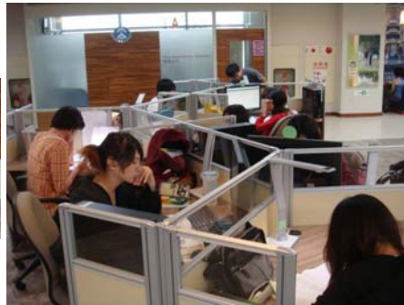
自修及論文寫作區